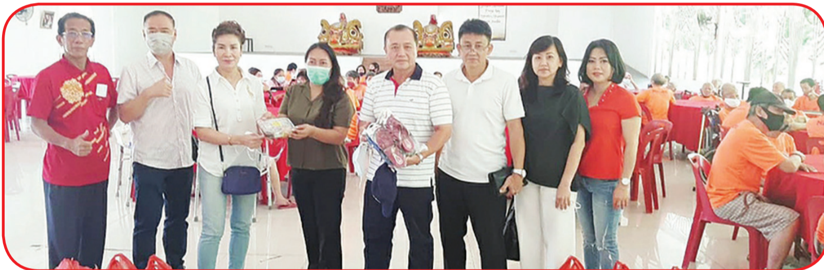
SIMBOLIS: Pengurus Kelompok Lapangan Senam Peremajaan Diri (Haqi) BCA Medan secara simbolis menyerahkan bantuan kepada Pimpinan Panti Jompo Bodhi Asri Pegy.

Pimpinan Panti Jompo Bodhi Asri Pegy menyatakan terima kasih atas kerja keras dan bantuan yang diberikan.