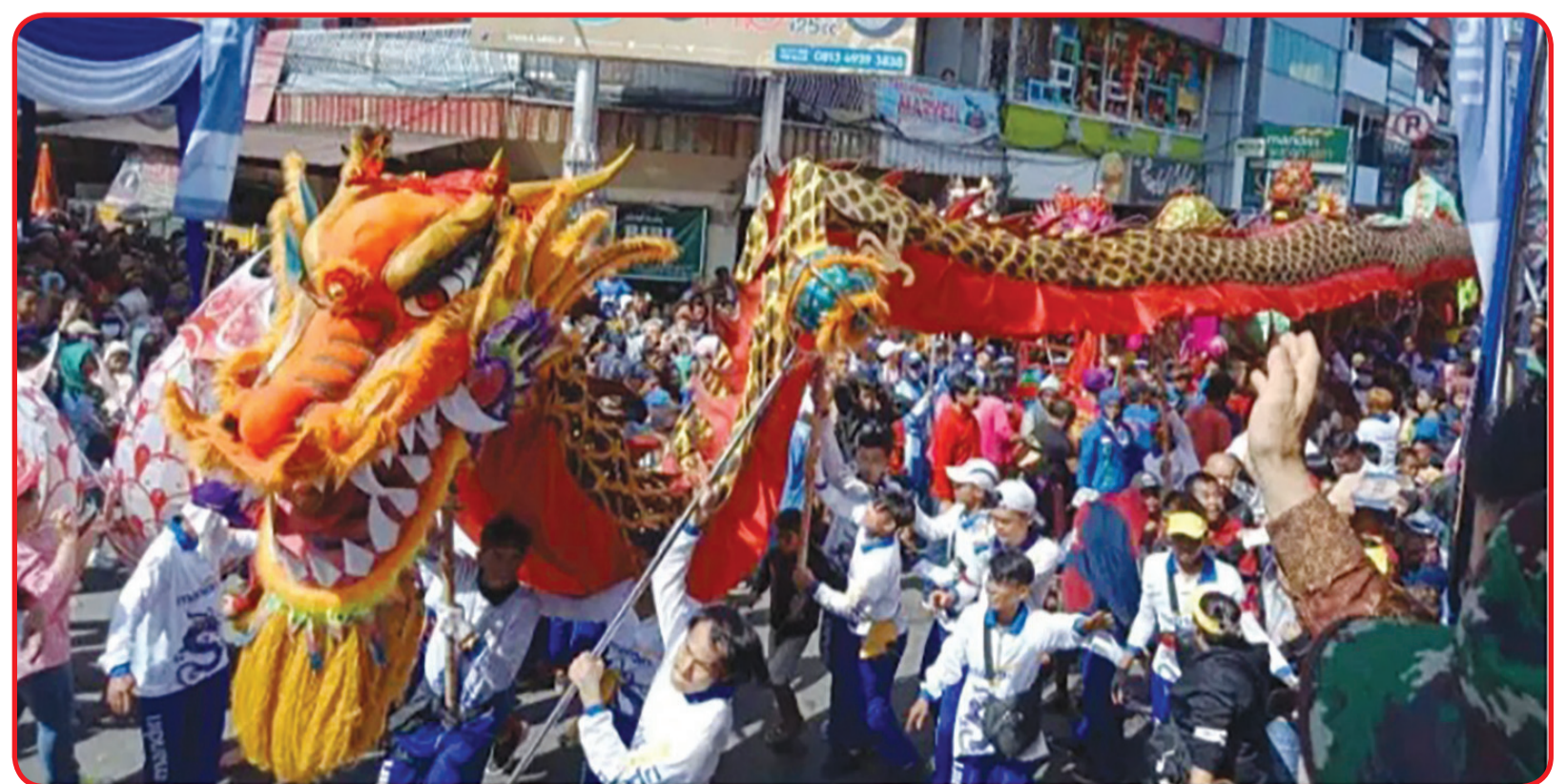
LIONG: Atraksi liong pada perayaan Imlek 2020 lalu.

"Kami sangat mendukung langkah Gubernur Kalbar yang meniadakan perayaan Cap Go Meh di Kalbar," ungkap Hendry. • idn/din