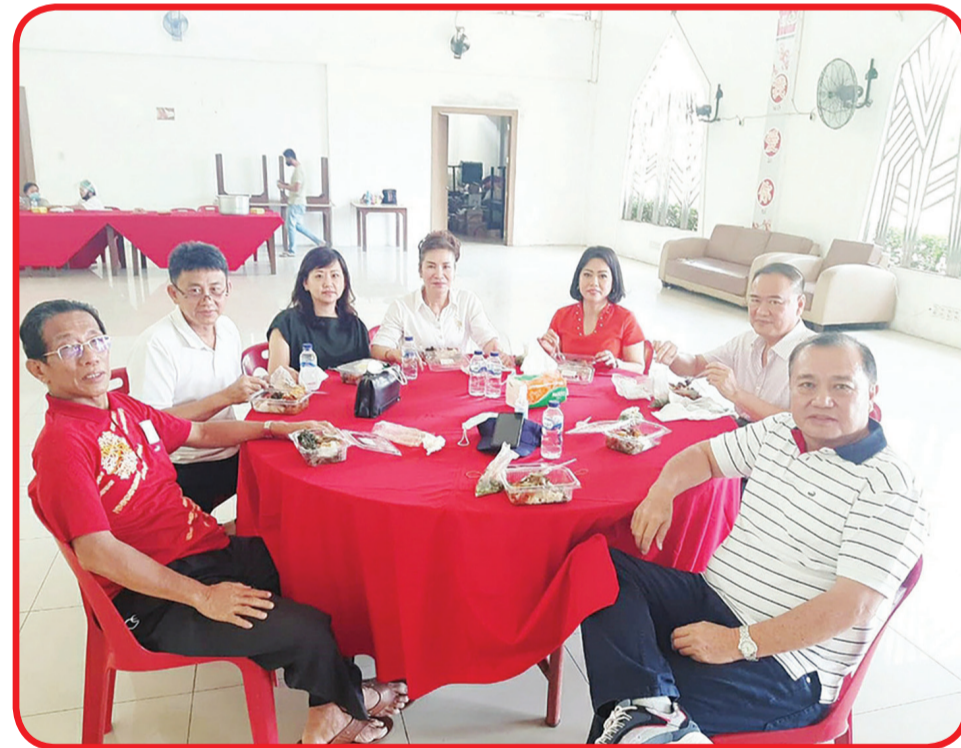
HAQI BCA MEDAN: Anggota Kelompok Lapangan Senam Peremajaan Diri (Haqi) BCA Medan berfoto bersama.