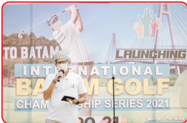
Memparekraf Sandiaga S Uno

Memparekraf Sandiaga Uno saat peluncuran “International Batam Golf Championship Series 2021” di Padang Sukajadi, Jumat (22/1), mengapresiasi penyelenggaraan event wisata olahraga yang diinisiasi