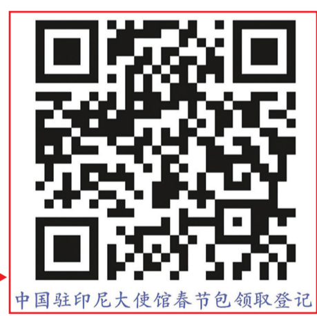
中国驻印尼大使馆春节包领取登记

Barcode Pendaftaran untuk Memperoleh Paket Imlek Kedubes Tiongkok di Indonesia.